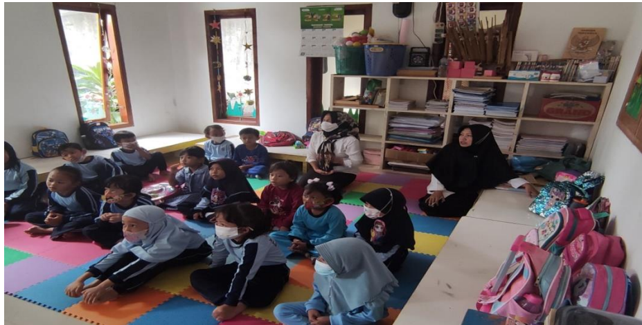
Gambar 2. Foto Kegiatan Pengabdian Kepada Masyarakat