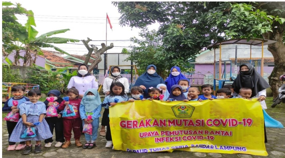
Gambar 3. Foto bersama